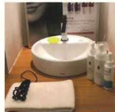
備え付けの円型洗面台

「お客様目線」「女性目線」でのお気づき・ご指摘は大変貴重かつ有用なものでございますので、有難く受け止めて頂いております。弊社が目指す”より良いサロン作り”の為に、今後も遠慮なくお申し付け下さると幸いです。