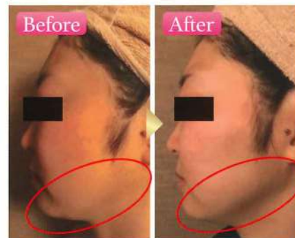
肌の透明感とフェイスラインに変化が！