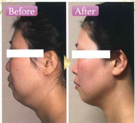
リンパマッサージ+光フェイシャル1回