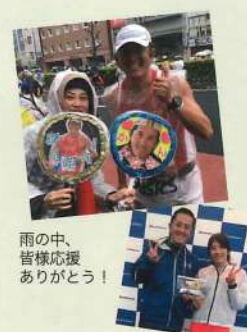
雨の中、皆様応援ありがとうございました！

今回、風邪からの蓄膿症！インフルエンザで全く練習が出来ませんでした。3回のビタミンドロップ糖質制限無視での糖質吸収、ジムでの筋トレの甲斐あって、4時間17分でゴールしました！ 今後は自分の競技はお休みし、息子の闘争をまず2年間鍛えに鍛え、一緒に苦勞して勝利をつかみたいと考えています。