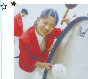
吹奏楽部時代。当時の印刷物を写メったので画像が荒くてすみません(;;) 吹奏楽部では大太鼓の担当でした！

私が声を大にして紹介したい事は、「音楽を演奏したり音楽に合わせて踊ったりしてる事」です。 小さい頃からダンスやドラムを習っていた影響で、時間があればダンスを踊ったり家でドラムを叩いたりしています。ダンスはたくさんのジャンルがある中からヒップホップを8年、ブレイクダンス2年、カラーガードを3年間。音楽に合わせて踊りを変えて踊るのが大好きです！ ドラムもヒップホップと一緒に8年間習っていて、中学・高校では吹奏楽部に所属していました。家にはドラムがあったり、カラーガードで使う旗やライフルもあります。 仕事が休みの時は体を動かしています。体を動かすことで汗をかき、リフレッシュにもなるので皆さんも是非！曲に合わせて踊ったり演奏してみてください！