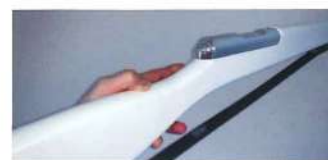
カラーガードのライフルです。3年使っています(^^)