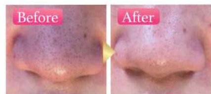
毛穴洗浄+パックで毛穴がスッキリ！