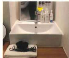
スペースの最大限、広げました!

●カレンに通って下さっている会員の皆様の本音・気になった事・知りたい事・リクエスト・普段は言いにくい事 etc. どんな内容でも結構です。「メール・お手紙・fax・web お問合せ」から皆様の「お声」、お待ちしております。 ●投稿頂く中で、お名前・連絡先(電話番号)の記載がない場合、メール返信でその旨お送りしても、「迷惑メール扱い」で弾かれる場合がございます。この場合、抽選から外れてしまいますので、お名前等の記載をお願い致します。(又は、受信設定をお願い致します)